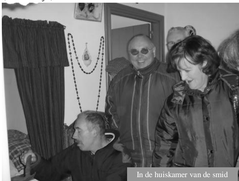
In de huiskamer van de smid

Na de soep brengen we een bezoek aan het kerkhof van de Martinuskerk. Even staan