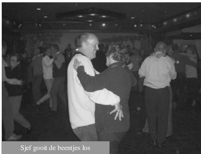
Sjef gooit de beentjes los

Waarom niet spontaan voor in de zaal op het podium,